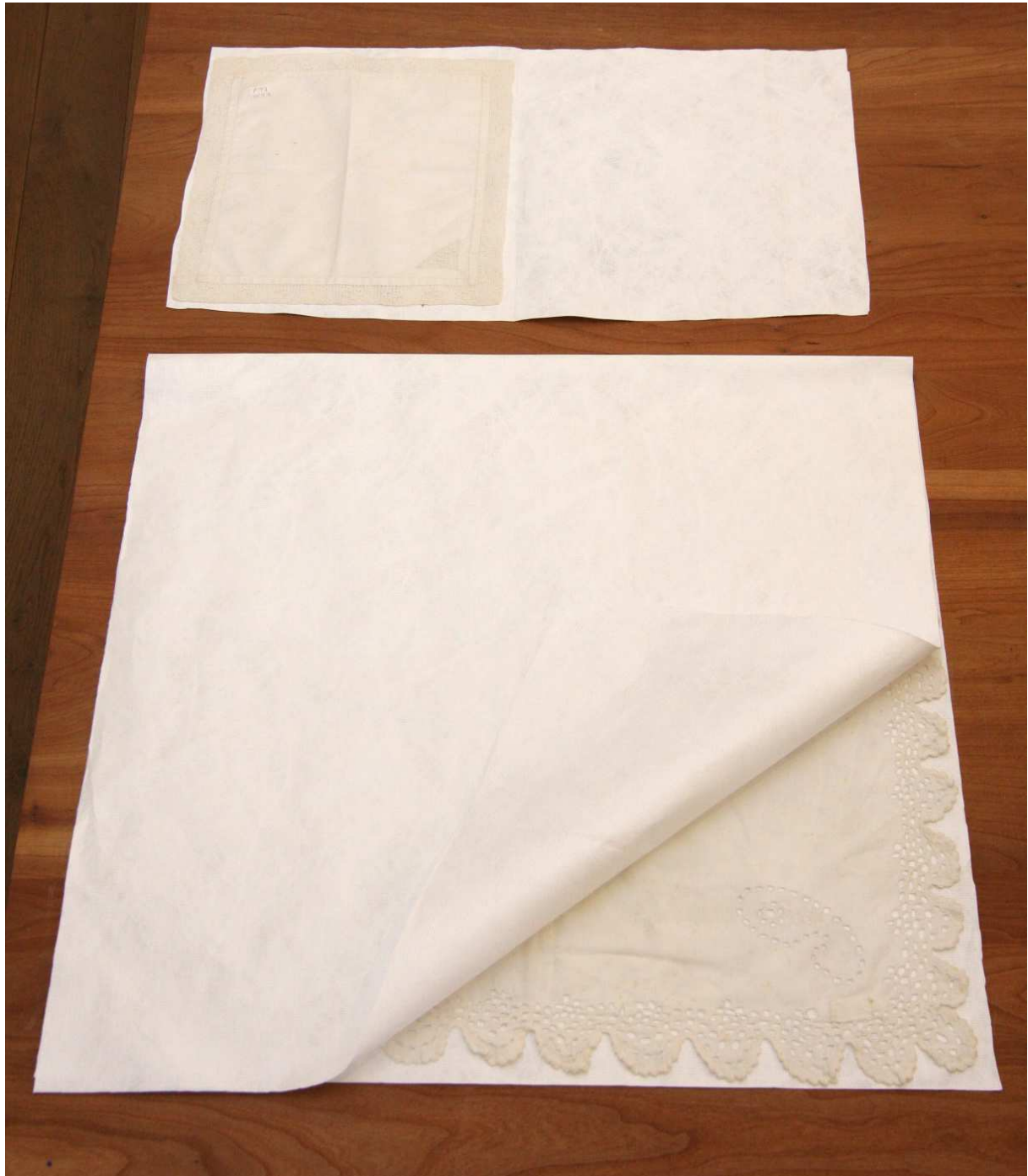
Tyvek műtárgytároló anyag a helytörténeti textilek számára