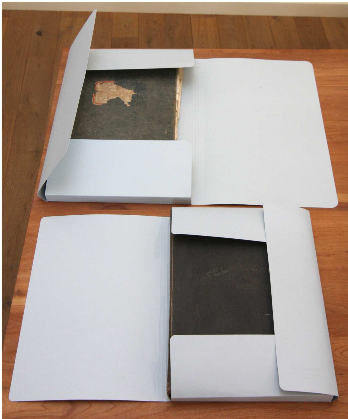
VOLTAIRE pólyás dosszié két méretben a nagyméretű múzeumi könyvek számára