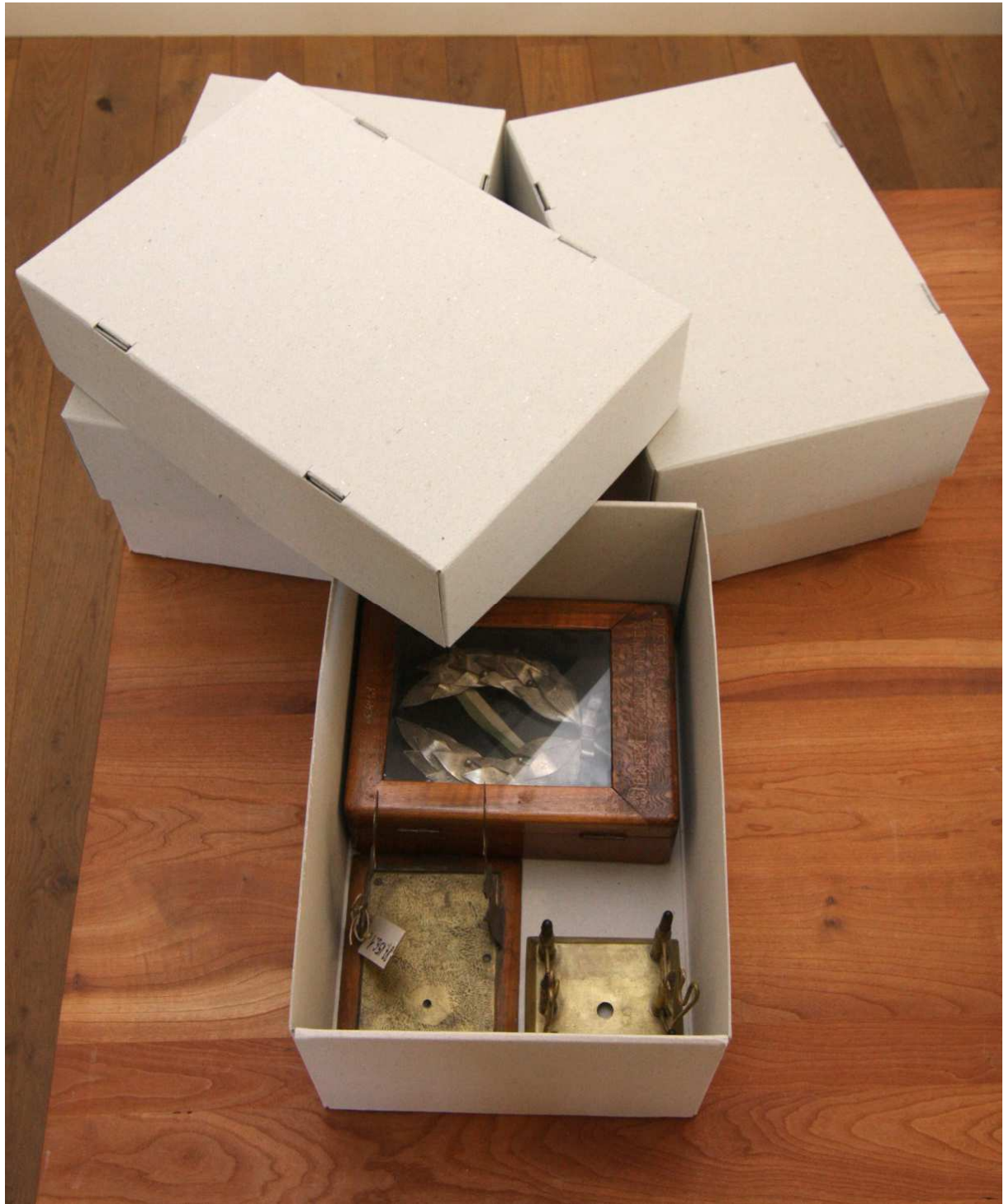
LORELEY I. raktári tárolódobozok tetővel a helytörténeti műtárgyak számára