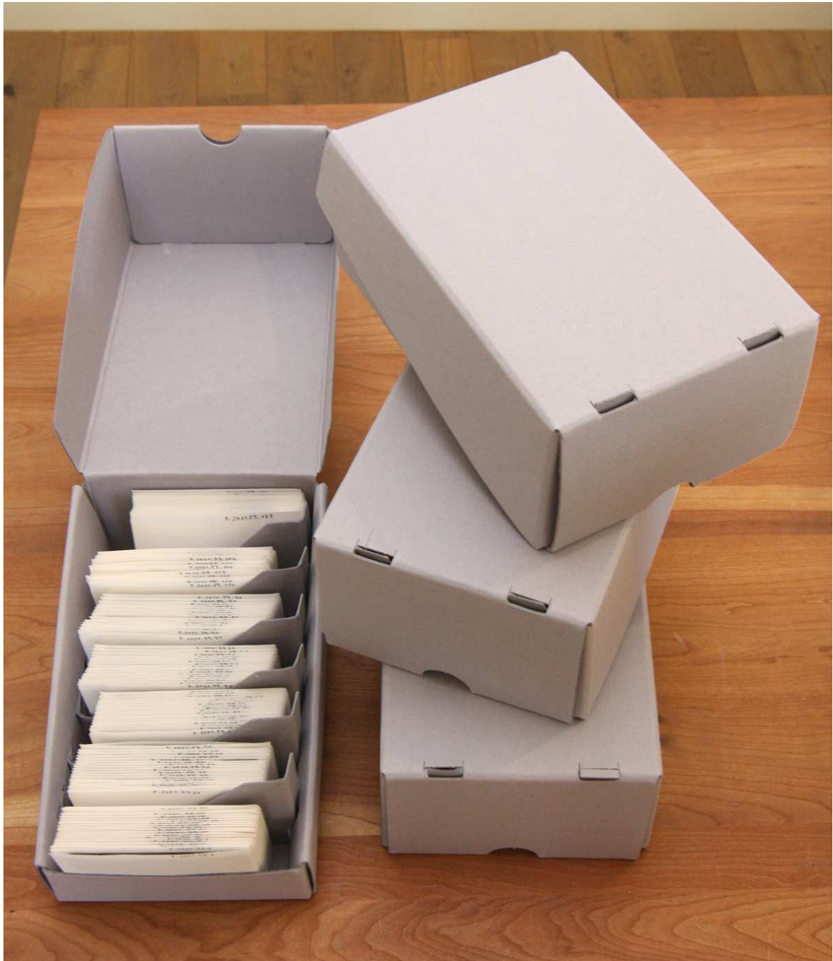
Prizma I. fotódobozok és PAD papírtasakok az üvegnegatívok számára