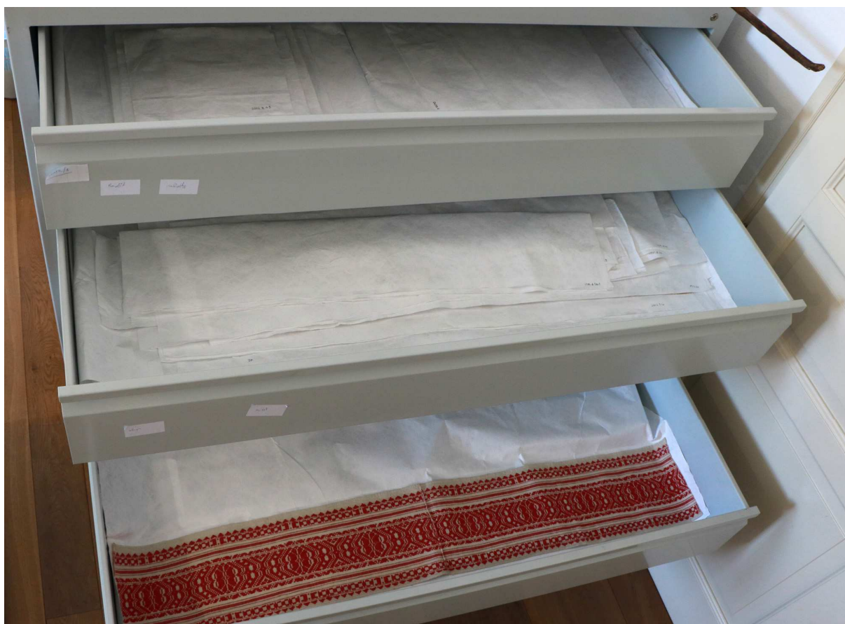
Tyvek anyagba csomagolt textilek