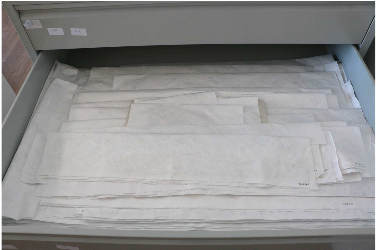
Tyvek anyagba csomagolt textilek