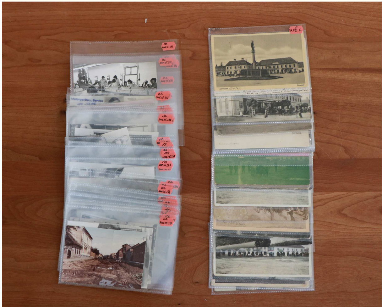
iSafe polipropilén tasakok két méretben