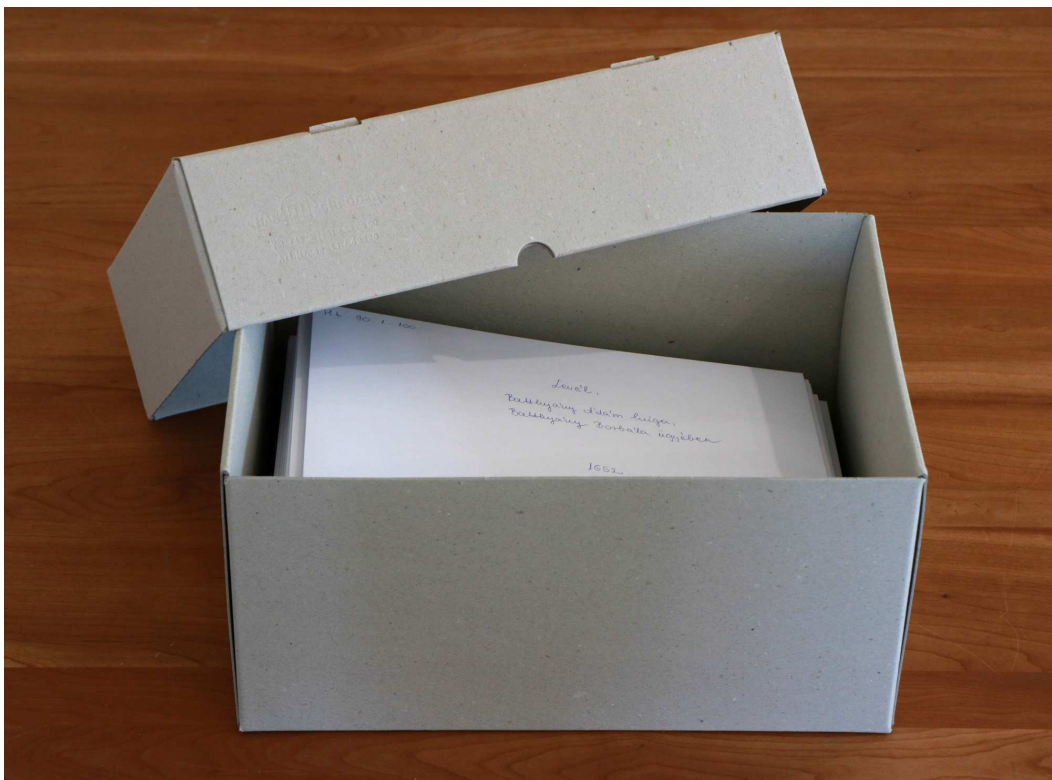
Loreley raktári tárolódoboz