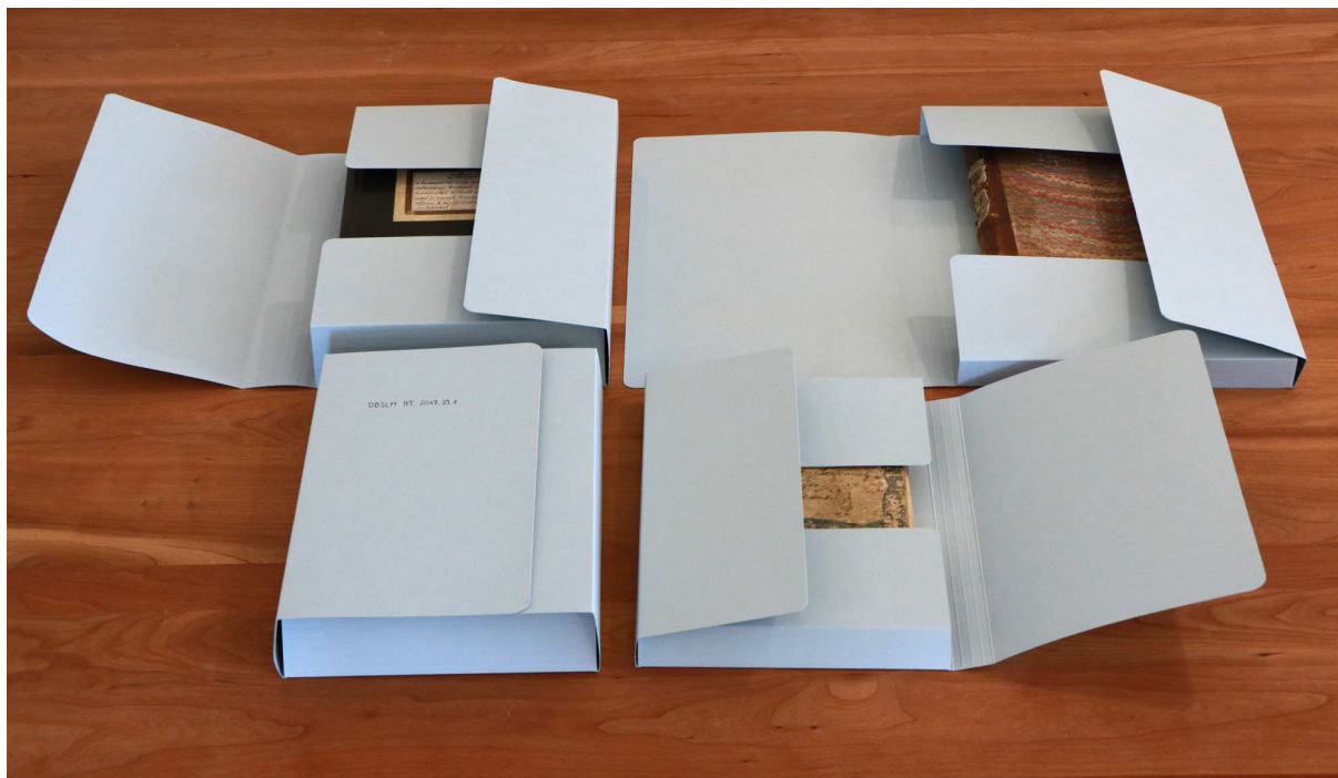
Voltaire pólyás dosszié négy méretben