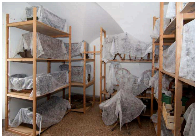
Konzerválás utáni elhelyezés