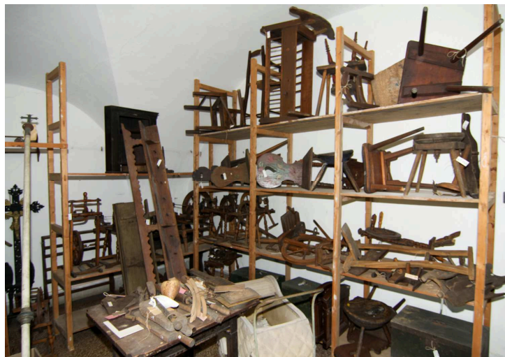
Gázosításhoz összerakott tárgyak