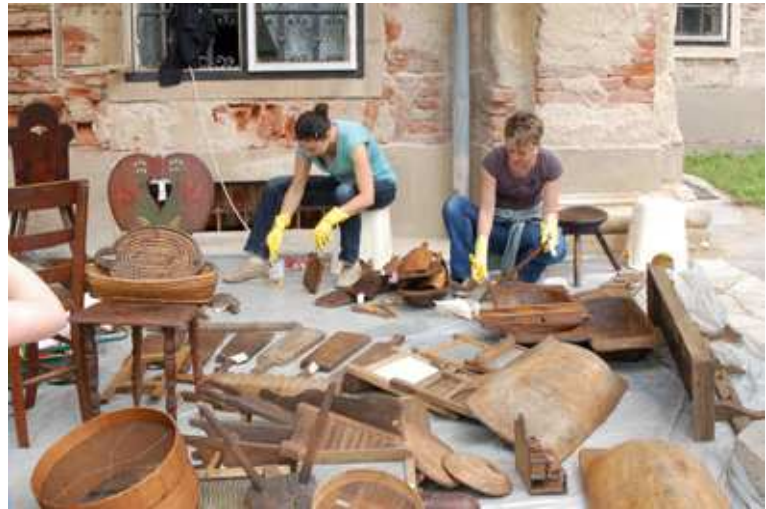
A tárgyak xylamonos konzerválása