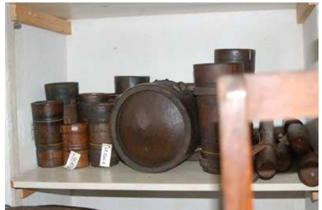
A tárgyak elhelyezése a raktár polcain