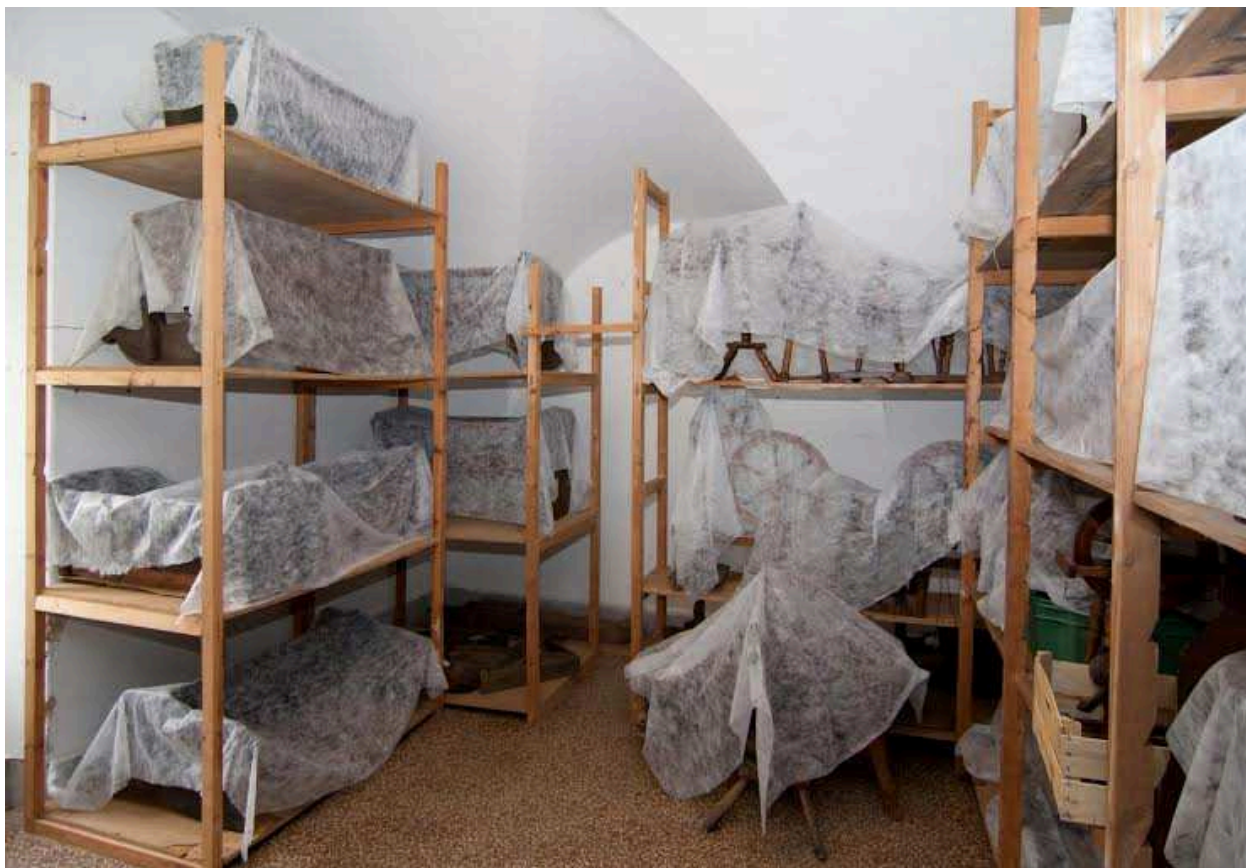
Raktári rend kialakítása