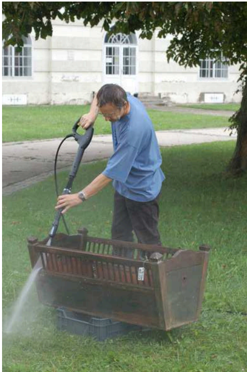
Tisztítás magasnyomású mosóval