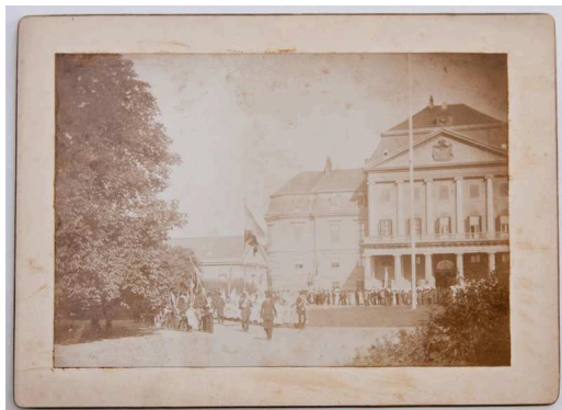
11. Fotó: Ünnepség a körmendi Batthyány-kastély előtt

Méret: 16,5x12 cm. A kartonra ragasztott fénykép Körmen főterének északkeleti részét ábrázolja a 20. század elején. A téren ünneplőbe öltözött tömeg, a tisztiház tetőablakában nemzeti színű zászló lobog, a kép bal oldalán pedig a Maria Immaculata szobor áll. A fotó a körmendi főtér egyik legkorábbi ábrázolása. DBSLM Ht.2014.3.10