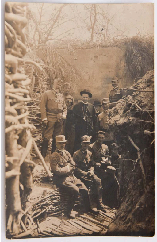
7. Fotó: Mikes János szombathelyi püspök látogatása a fronton

Mérete: 9x14 cm. Gróf Mikes János (1876-1945) szombathelyi megyéspüspök orosz fronton történt látogatását ábrázoló fotó 1915-ben készült.