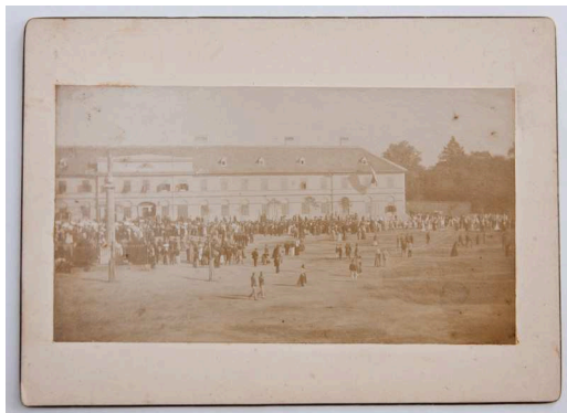
10. Fotó: Ünnepség a körmendi főtéren

Méret: 12x16,5 cm. A kartonra ragasztott fénykép 1920 körül készülhetett, emiatt rendkívül fontos forrás a körmendi Szent Erzsébet plébániatemplom korábbi festéséről. 1938-ban ugyanis a templom belső falfestéseit átfestették, ez a fotó pedig az eredeti freskókat dokumentálja. DBSLM Ht.2014.3.9