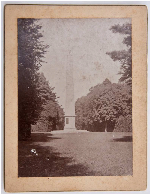
8. fotó: Obelisz a Várkertben

Méret: 10x13 cm. A kartonra ragasztott fotó a körmendi Batthyány kastély kertjében 1810-ben felállított obeliszket ábrázolja. A fotó az I. világháború idején készülhetett, így egyike a legkorábbi várkerti obeliszek ábrázolásoknak. DBSLM Ht.2014.3.8