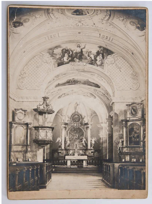
9. Fotó: A körmendi katolikus templom belseje

Méret: 12x16,5 cm. A kartonra ragasztott fénykép 1920 körül készülhetett, emiatt rendkívül fontos forrás a körmendi Szent Erzsébet plébániatemplom korábbi festéséről. 1938-ban ugyanis a templom belső falfestéseit átfestették, ez a fotó pedig az eredeti freskókat dokumentálja. DBSLM Ht.2014.3.9